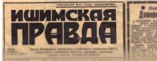
Газета «Ишимская правда» №26 от 14.02.1964 г.

Сегодня больница включает врачебную амбулаторию, стационар круглосуточного пребывания на 8 коек, стационар дневного пребывания на 10 коек и 8 фельдшерско-акушерских пунктов. Сотрудники больницы обслуживают 15 населенных пунктов