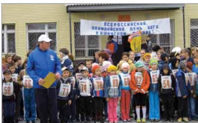
Юные спортсмены села Карасуль