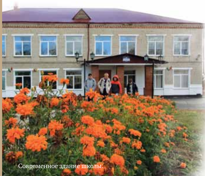
Современное здание школы.