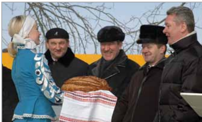
Церемония торжественного открытия спорткомплекса. Март 2005 г.