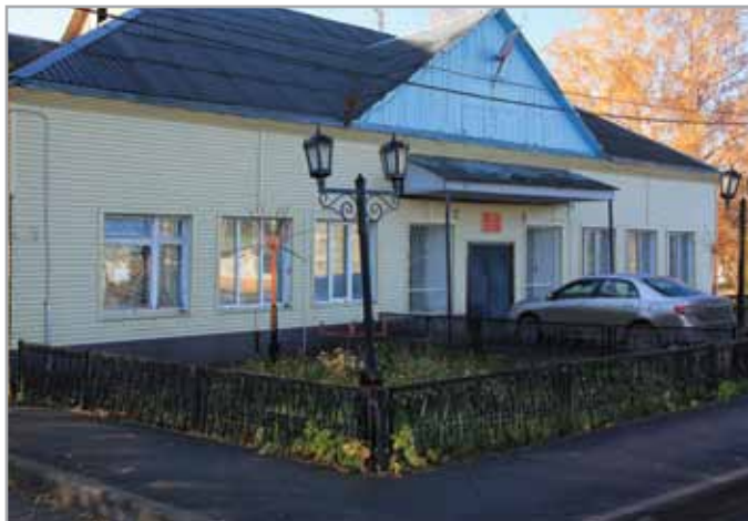
Здание администрации района

В настоящее время на территории сельского поселения функционируют завод по переработке мяса – «Карасульский» с годовым объемом производства 164 тонны. Продукция реализуется в Ишиме, Тобольске, Нефтеюганске, Мегионе, Пыть-Яхе. Число занятых на производстве составляет 12 человек.