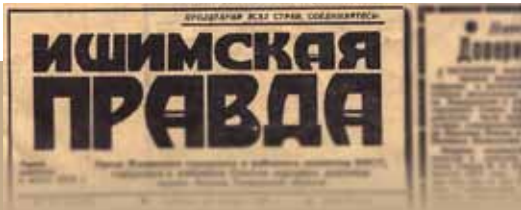
Газета «Ишимская правда» №16 от 05.02.1960 г.

во все отделения совхоза были проведены радио и электричество, построены своя электростанция и машинотракторная мастерская. На фермах установили передвижные электростанции и автопоилки, а на ферме «Комсомольская» – автоматизированную дойку. В 1956 году вошла в строй новая электростанция мощностью 35 кВт. В 1960–1962 годах электричество было проведено во все жилые дома с. Карасуль. В 1960 году совхоз объединял уже 18 ферм. В 1960–1963 годах было построено значительное количество жилых домов, магазинов, детские ясли, столовая, комбинат бытового обслуживания. Сре-