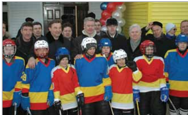
Юные хоккеисты с почетными гостями