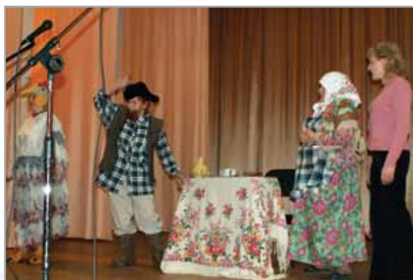
Участники художественной самодеятельности