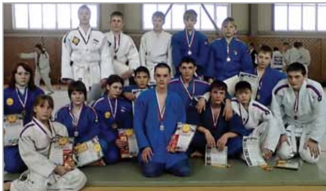
Призёры соревнований по дзюдо 2011 г.

большом чемпионате области, а команда по хоккею с шайбой получила «бронзу» Кубка губернатора по югу Тюменской области. Сельские спортсмены показывают высокие результаты и в других видах спорта. Статистика утверждает, что спортом постоянно занимается каждый четвертый (!) житель сельского поселения. Спортивная команда из Карасуля – неоднократный