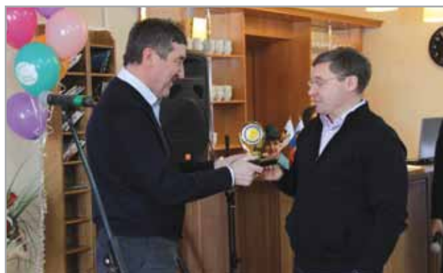
Памятный знак фонда губернатору В.В. Якушеву