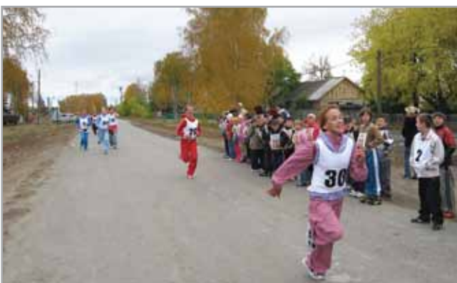
Спортивные мероприятия в школе