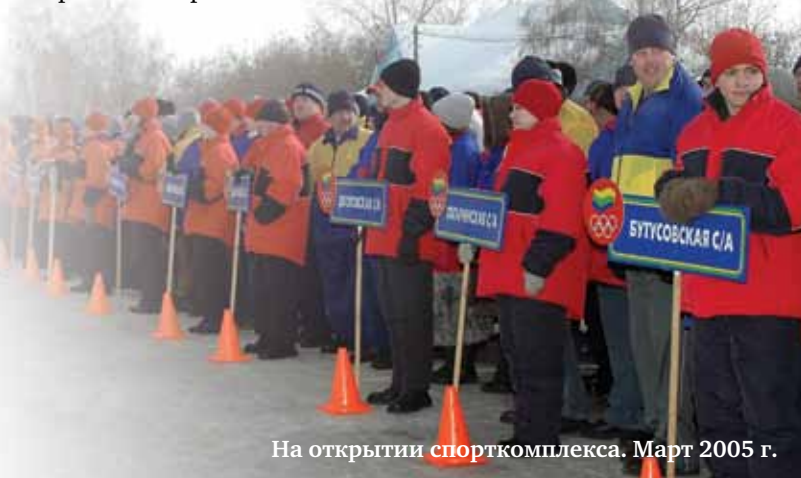
На открытии спорткомплекса. Март 2005 г.