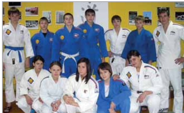
Команда дзюдо 2010 г.

Поддержка физкультуры и спорта на селе стала основным, но не единственным направлением деятельности Фонда. В рамках программы оказания помощи учреждениям здравоохранения Карасульской участковой больницы был передан в безвозмездное пользование автомобиль. Не обделена вниманием и сельская школа. Ежегодно наиболее отличившимся выпускникам вручают подарки от Фонда, а лучшим педагогам – грамоты Фонда, денежные премии и особые памятные знаки. При непосредственном участии Фонда и телерадиокомпании «Регион-Тюмень» на выпускном вечере Карасульской средней школы был снят видеофильм с поэтическим названием «Карасуль. Темная вода», в котором звучит песня о селе, написанная тюменским композитором, автором и