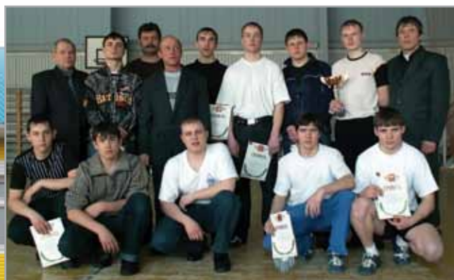
Сборная по гиревому спорту