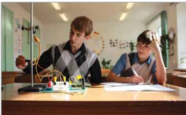
На уроке физики